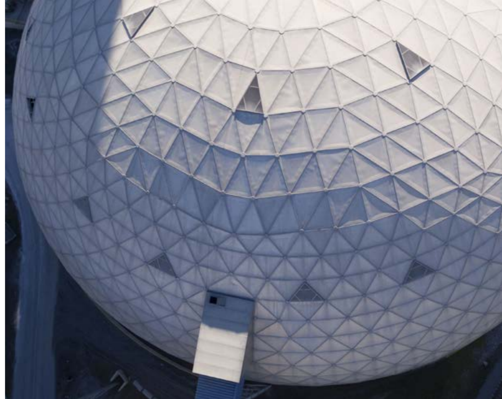
Planta Martinsburg de Cementos Argos Estados Unidos

Incluyendo los dividendos y la valorización de la acción desde el año 2000, el retorno para los accionistas de esta compañía ha sido del 19,3% anual.