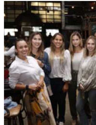
Programa Emprender Mujer Antioquia

En esta línea, durante 2021 Grupo Argos construyó e implementó un modelo de liderazgo inclusivo con el