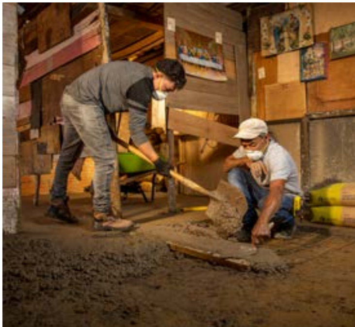
Hogares Saludables en Manrique Antioquia