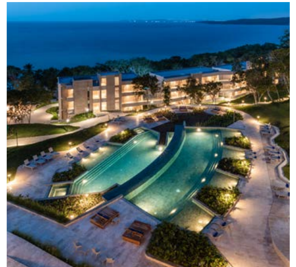
Hotel Sofitel Calablanca Barú Bolívar

COP 350 mil millones en ingresos futuros firmados en el Negocio de Desarrollo Urbano