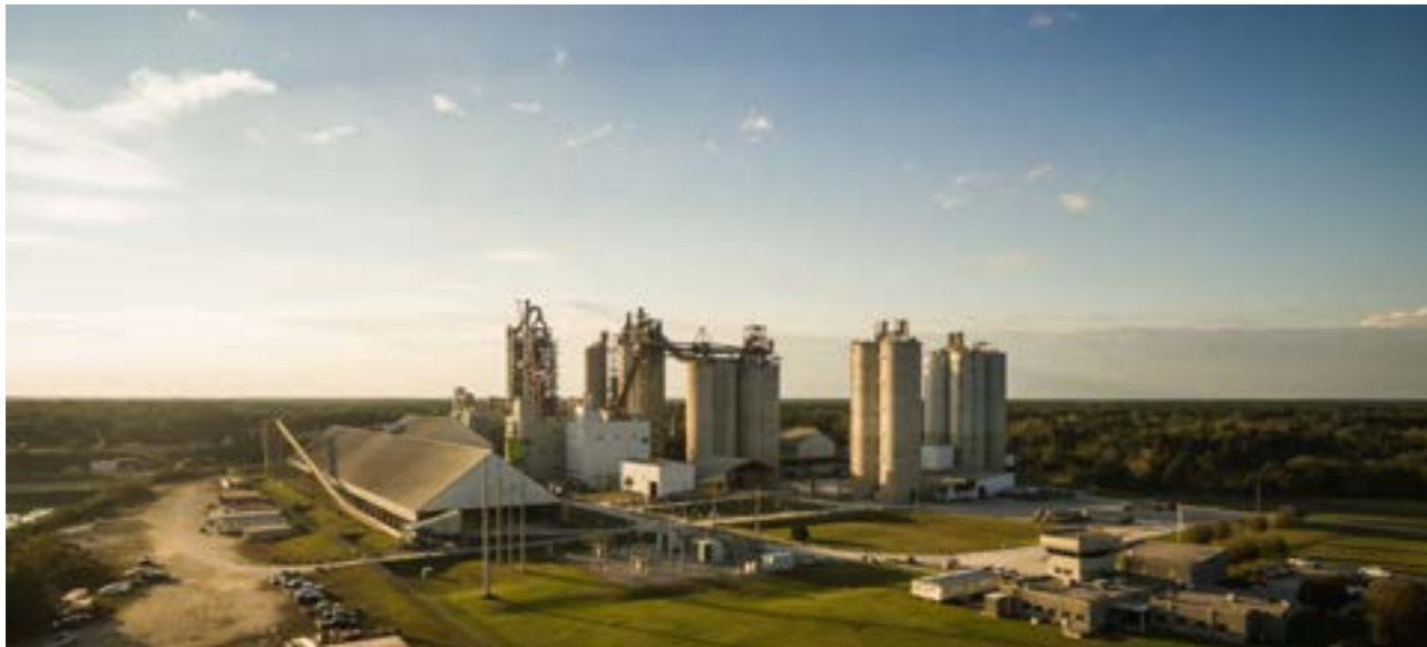
Planta Newberry Cementos Argos Estados Unidos