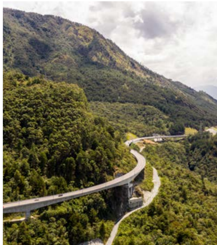
Túnel de Oriente Antioquia