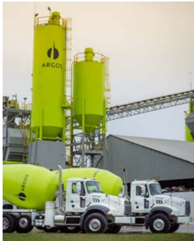
Planta Florida Cementos Argos Estados Unidos

Entre otros motivos, la brecha entre el valor fundamental y el precio de mercado, obedece a la baja liquidez y profundidad de la Bolsa de Valores de Colombia que durante la última década pasó de negociar USD 100 millones diarios a cerca de USD 30 millones diarios, lo que ha ocasionado que la mayoría de las acciones listadas en la Bolsa de Valores de Colombia, entre ellas las de Grupo Argos, se encuentren mucho más afectadas por variables exógenas que por la realidad de sus propios resultados financieros. Esta situación se repite para el mercado latinoamericano, dada la exposición directa que tienen estas economías al ciclo de commodities y que durante la última década sufrieron un periodo de precios bajos de materias primas que afectaron la economía y los mercados bursátiles.