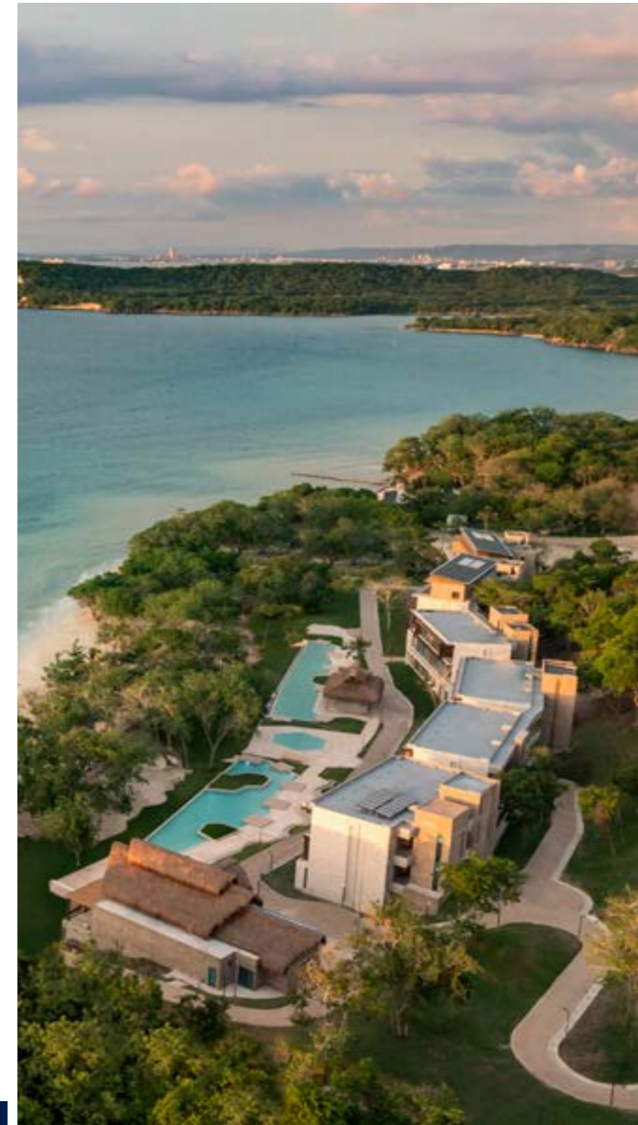
Hotel Sofitel Calablanca Barú Bolívar

Apreciados accionistas, pueden tener certeza de la prioridad que representa para los administradores de la compañía cerrar la brecha entre el valor fundamental y el precio de la acción, para lo cual Grupo Argos ha anunciado la aceleración de una serie de iniciativas estratégicas sobre las que nos referiremos más adelante.