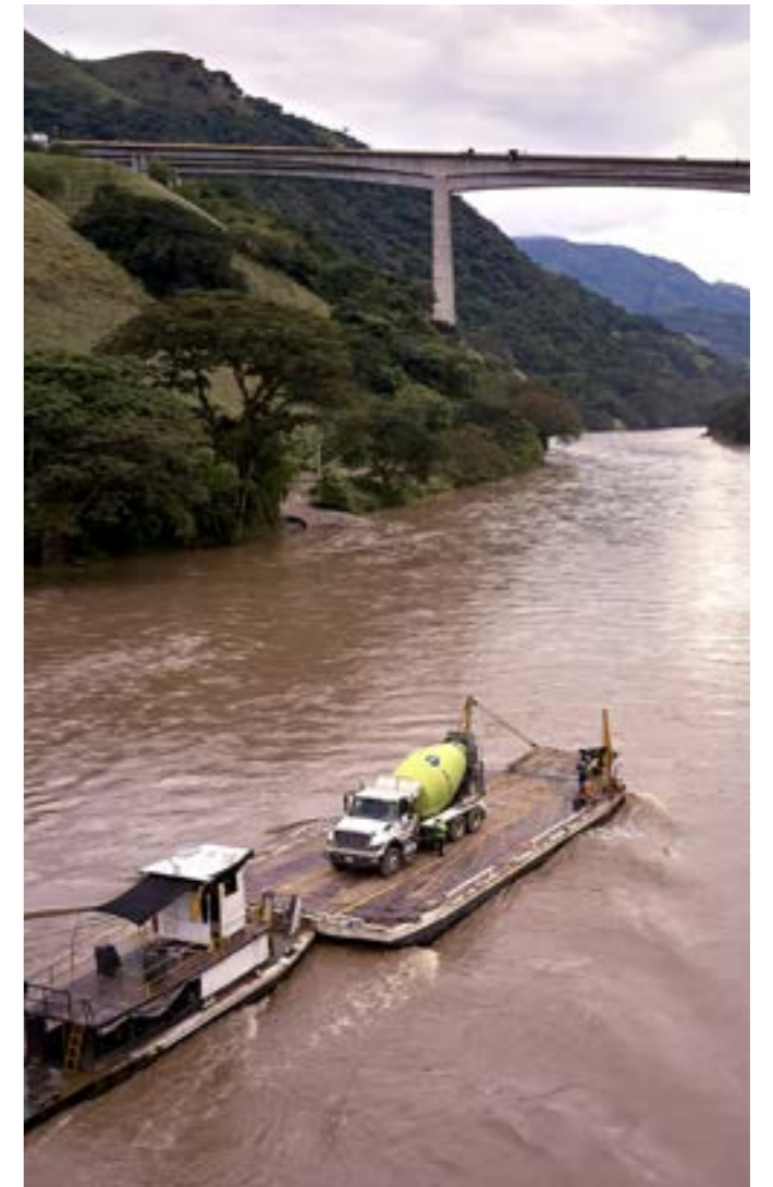
Pacífico 2 Antioquia

país y la región. La disciplina en la implementación de la estrategia ha movilizado transformaciones que se han traducido en el fortalecimiento de esta compañía. Destacamos la adquisición, durante los últimos años, de una importante base de activos de energía, rentas inmobiliarias y concesiones viales y aeroportuarias que en total suman COP 22 billones en activos bajo administración.