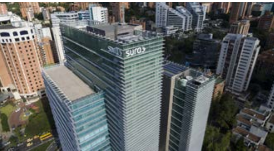
Sede de Grupo Sura Medellín