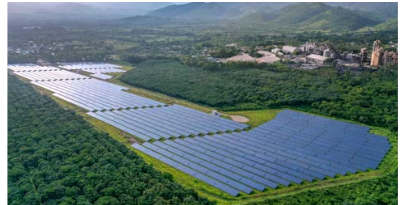
Celsia Solar Comayagua Honduras

70% incrementará la capacidad instalada de generación de energía de Celsia en los próximos cuatro años