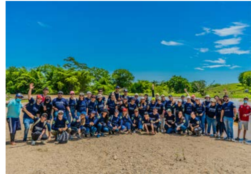
Voluntariado Conecta en Cocorná Antioquia