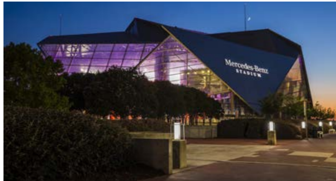
Mercedes Benz Stadium Atlanta Estados Unidos