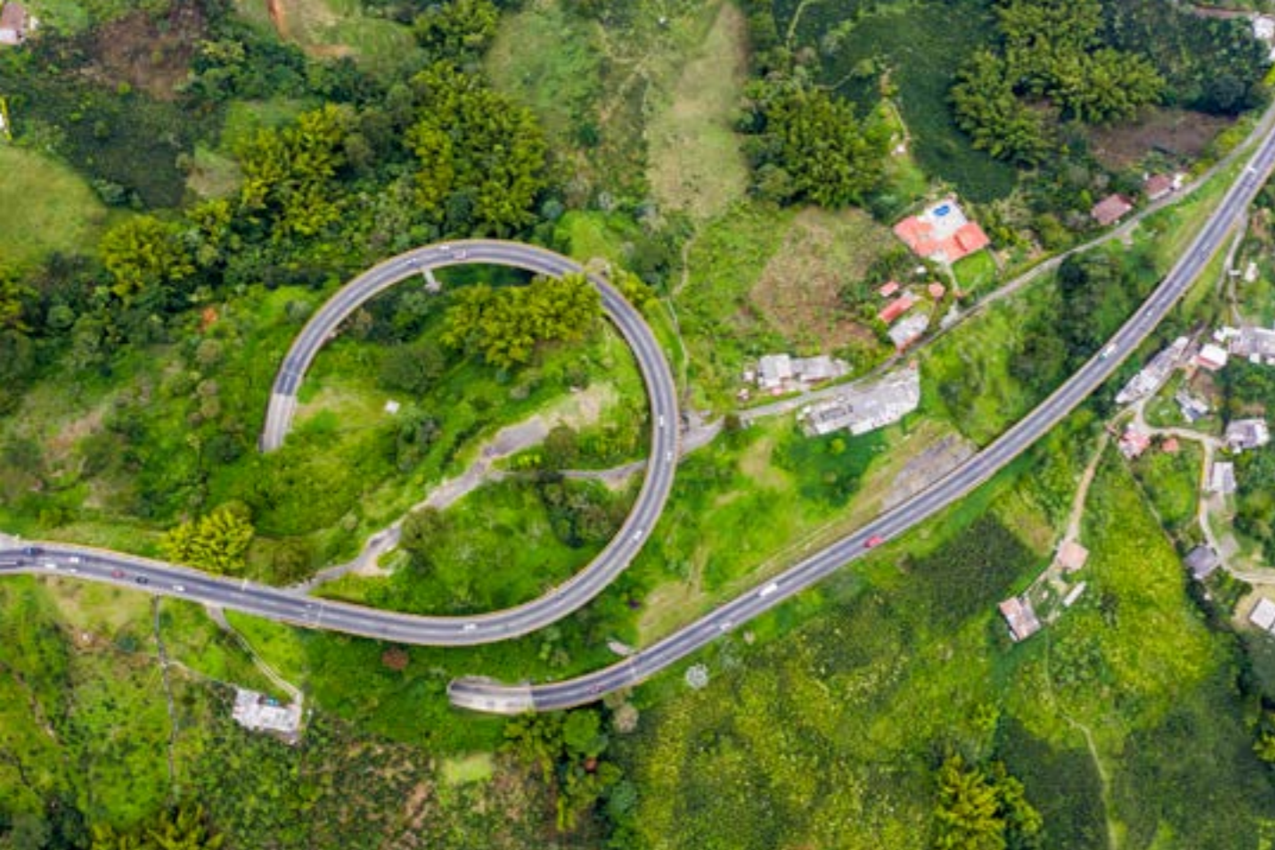
Autopistas del Café Eje Cafetero