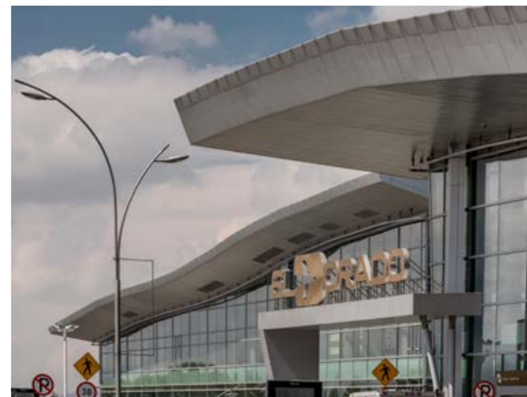
Aeropuerto El Dorado Bogotá

3 millones de pasajeros movilizó el Aeropuerto El Dorado en diciembre 2021