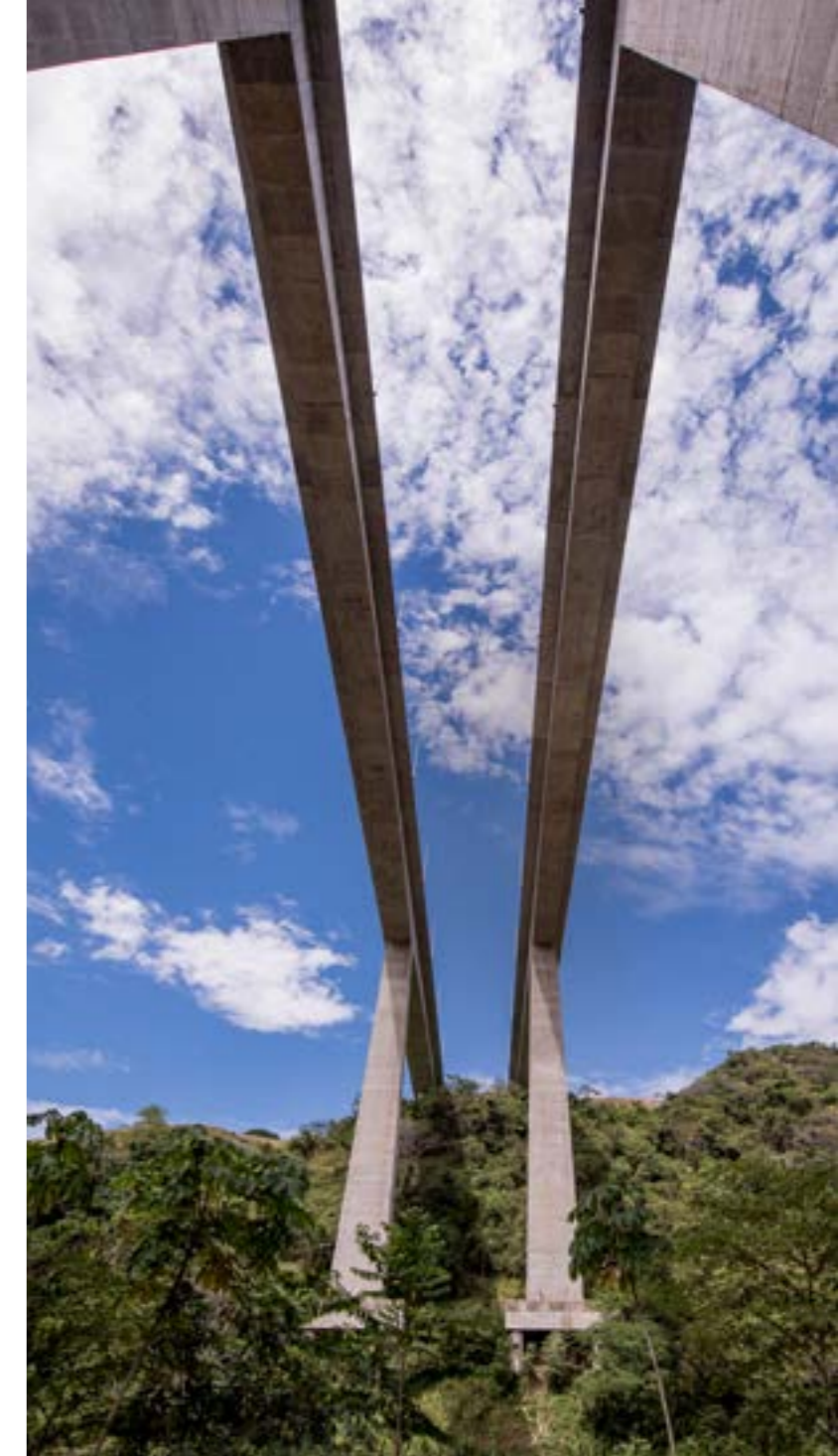
Pacífico 2 Bolombolo, Antioquia

Por otro lado, Grupo Argos celebró tres reuniones extraordinarias de la Asamblea General de Accionistas, así: el 3 de diciembre de 2021, el 4 de enero de 2022 y el 21 de febrero de 2022 para decidir sobre la autorización requerida en materia de potenciales conflictos de interés de algunos miembros de la Junta Directiva de Grupo Argos, para deliberar y decidir respecto de ofertas públicas de adquisición sobre acciones ordinarias de Grupo Nutresa S.A. y de Grupo Sura S.A. De igual forma, la Junta Directiva de Grupo Argos en sesiones siguientes a las reuniones extraordinarias de la Asamblea General de Accionistas deliberó y decidió sobre dichas ofertas públicas de adquisición. Todo lo anterior fue informado al mercado a través del mecanismo de información relevante.