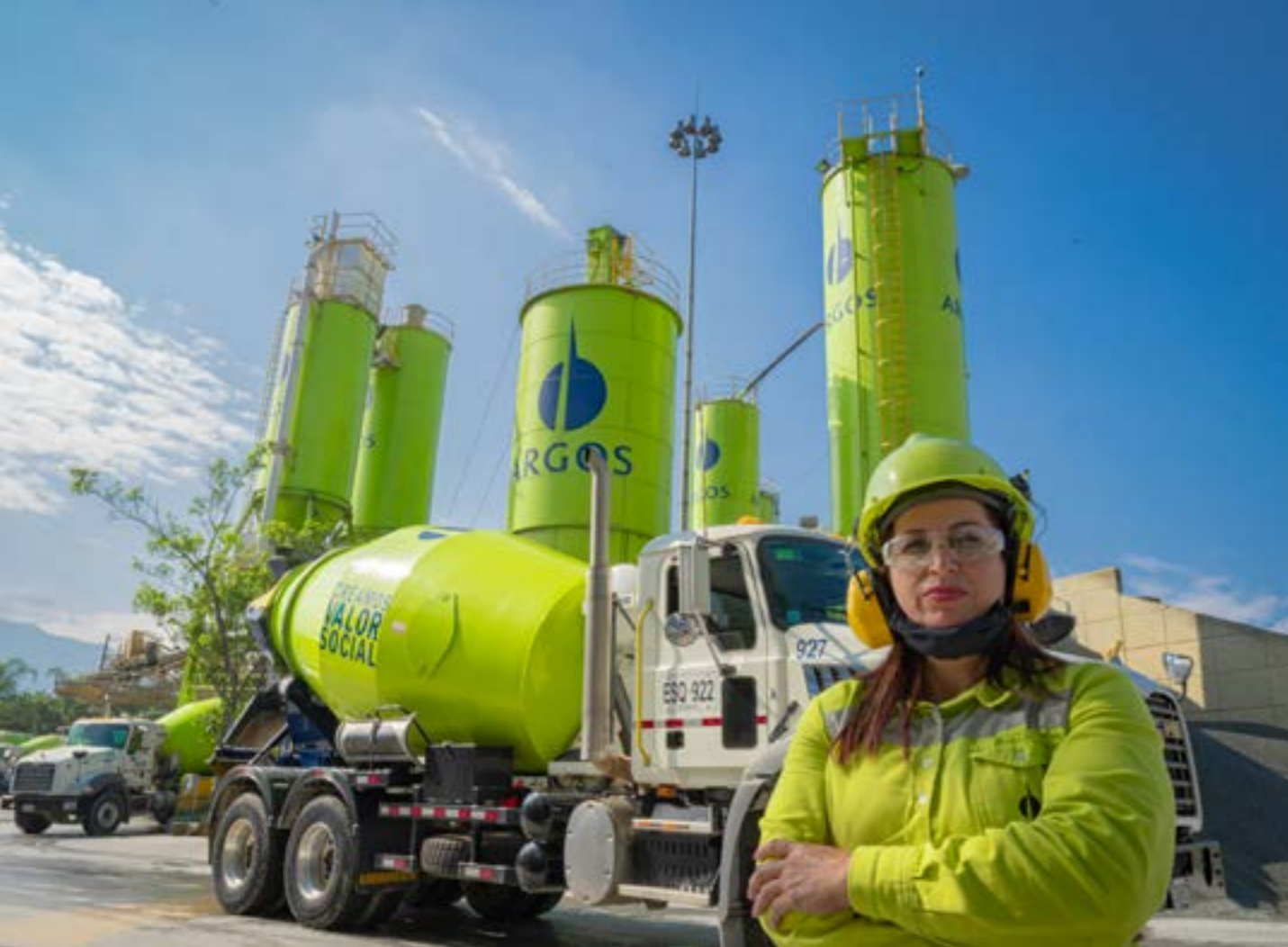
Conductora de mixer Antioquia