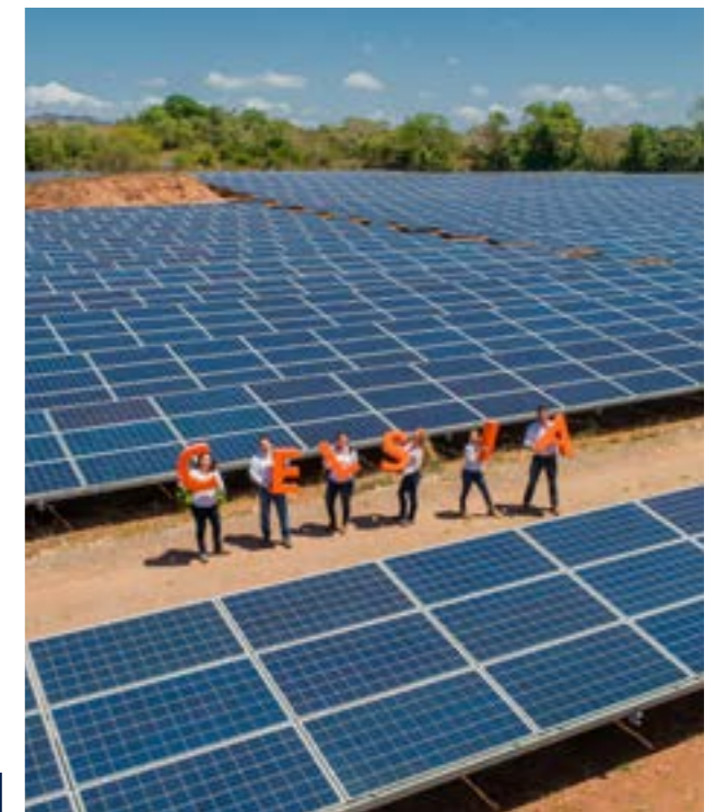
Celsia Solar Divisa Panamá

COP 2,6 billones en financiación sostenible para el Grupo Empresarial