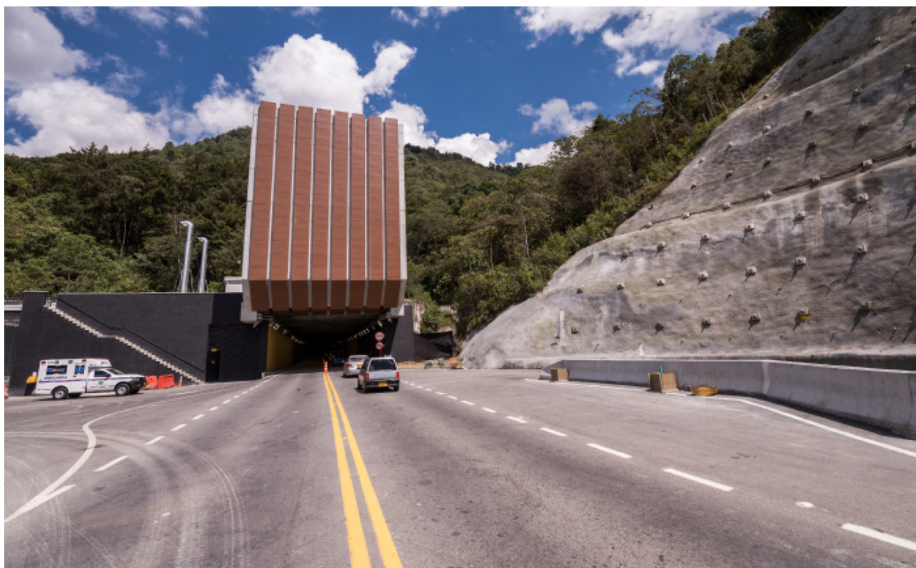
Túnel de Oriente Antioquia