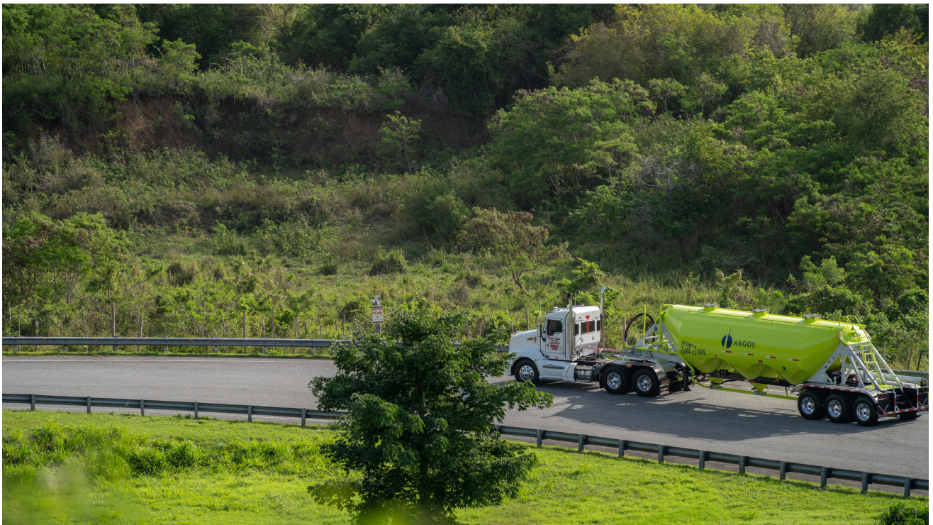
Camión Granelero Cementos Argos Puerto Rico