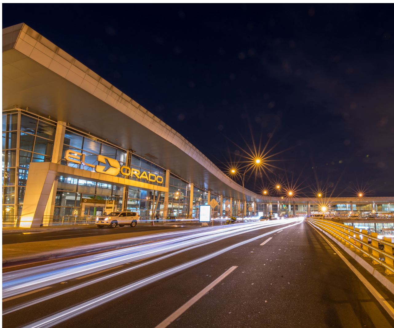
Aeropuerto El Dorado Bogotá