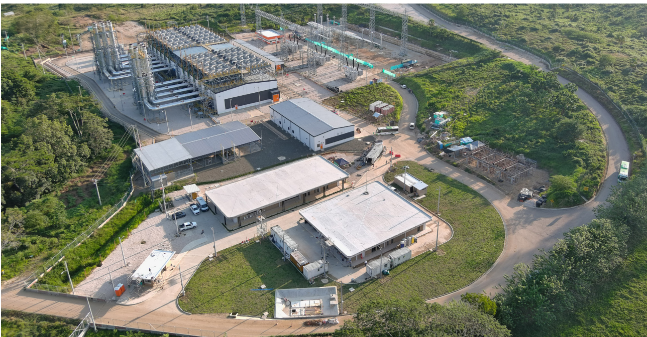
Central Termosorito Córdoba

Inestabilidad política, social, económica y jurídica a nivel global o local que puede afectar los resultados financieros y poner en riesgo las inversiones y la reputación de la organización.