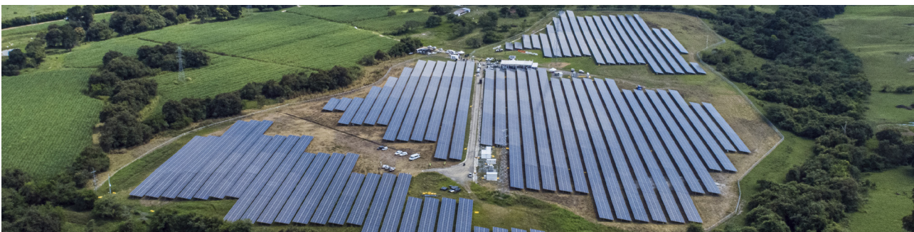
Celsia Solar La Palma Valle del Cauca