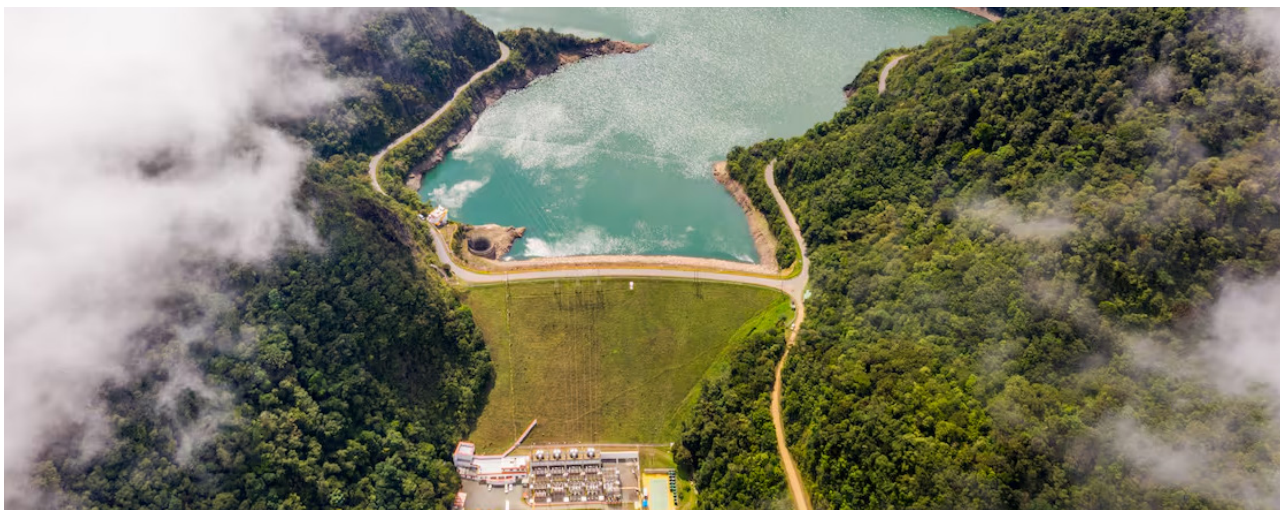
Celsia Hidroeléctrica Calima Valle del Cauca